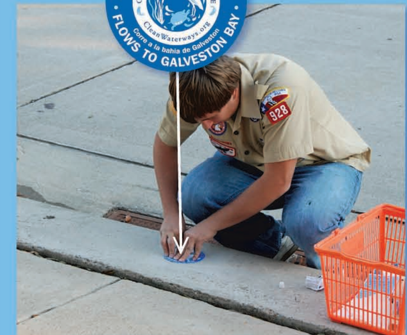
Programa de Marcar los Desagues de la Tormenta