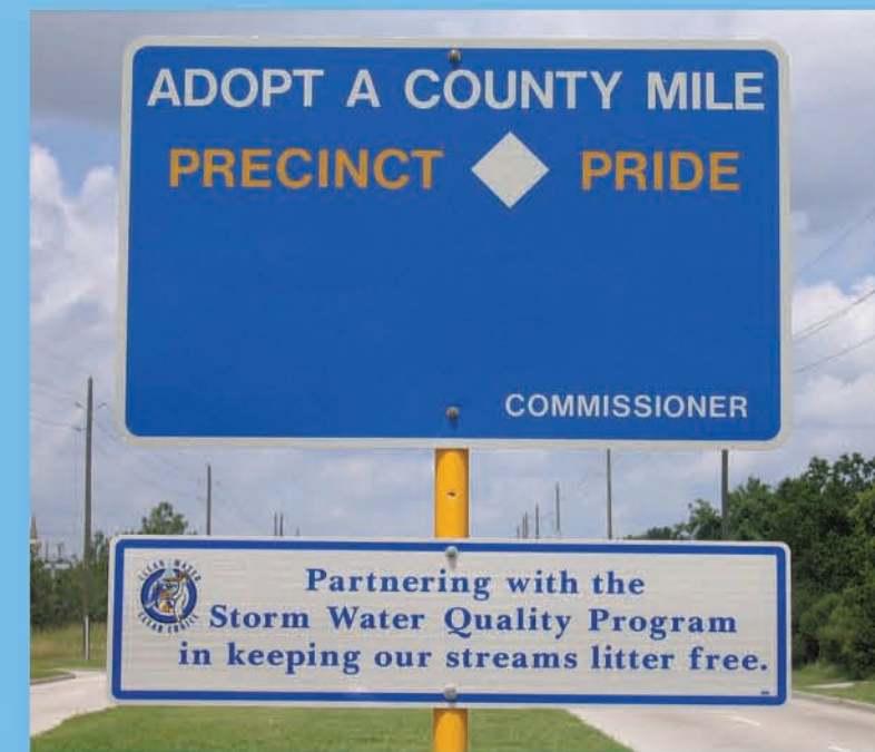
Programa de Adoptar una Milla del Condado